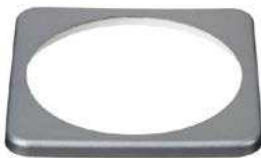
Embellecedor cuadrado BMV

Le recomendamos nuestro Battery Balancer (BMS012201000) para maximizar la vida útil de las baterías conectadas en serie.