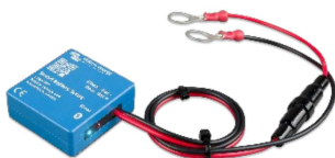
Sensor Bluetooth: Smart Battery Sense