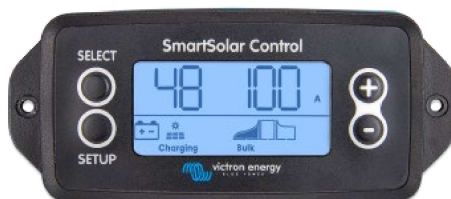
Pantalla enchufable SmartSolar