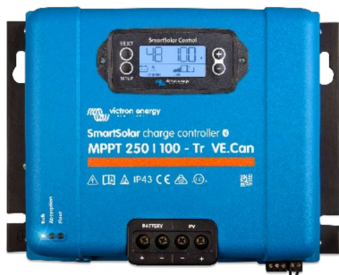
Controlador de carga SmartSolar MPPT 250/100-Tr-VE.Can con pantalla conectable opcional