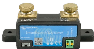
Bluetooth sensing: SmartShunt