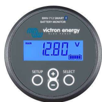
Sensor Bluetooth: Monitor de baterías BMV-712 Smart