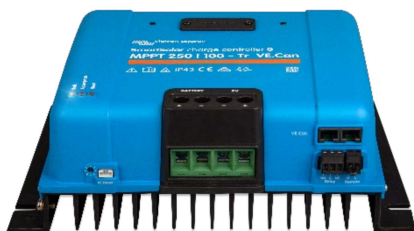
Controlador de carga SmartSolar MPPT 250/100-Tr-VE.Can sin pantalla